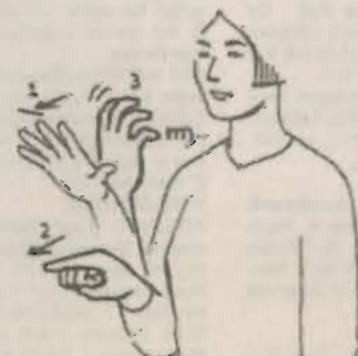
10 voor f 5,-