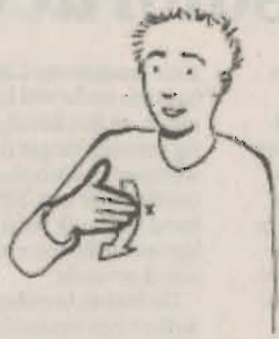
O zit, dat zo!